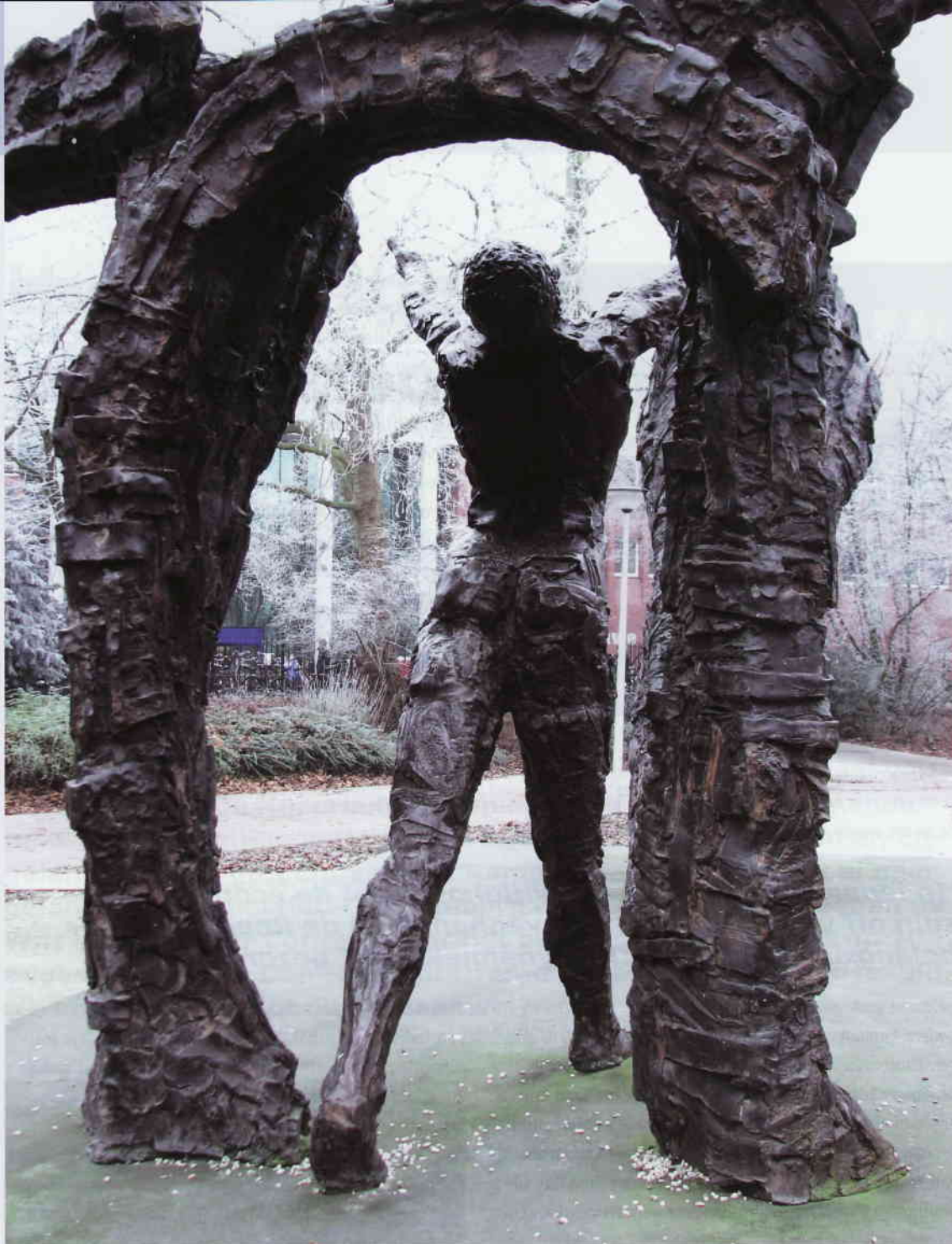
◀ Nationaal monument slavernijverleden (detail).