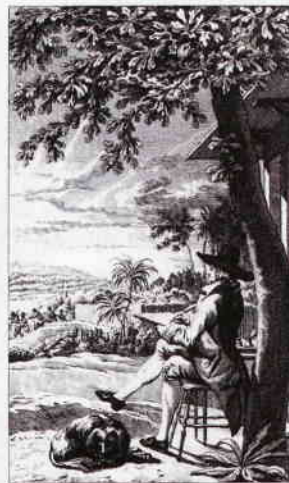
en ik was stil tevereden in de verte hoor ik de zweep van den bomba. I. D. Blasin. 1792.

Terug nu naar de tijd van de Republiek. De historicus Emmer heeft nogal eens beweerd dat de slavenhandel