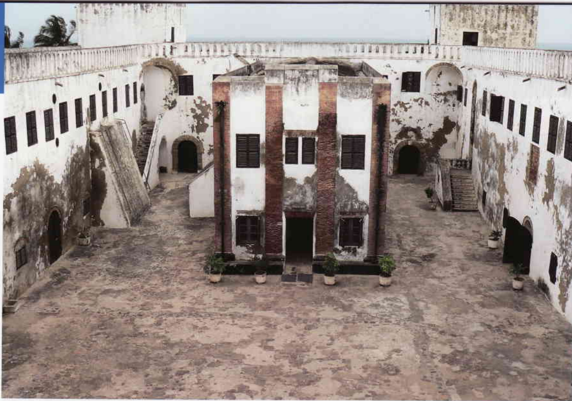
◀ De binnenplaats van fort Elmina, Ghana.