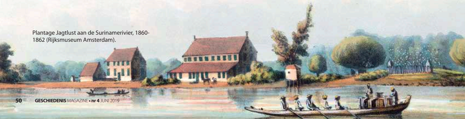
Plantage Jagtlust aan de Surinamerivier, 1860-1862 (Rijksmuseum Amsterdam).