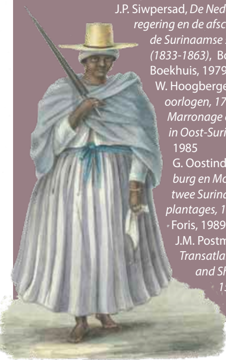
'Manumittée' (vrijgemaakte slavin), uit album met tekeningen van Suriname, ca. 1850-1860.