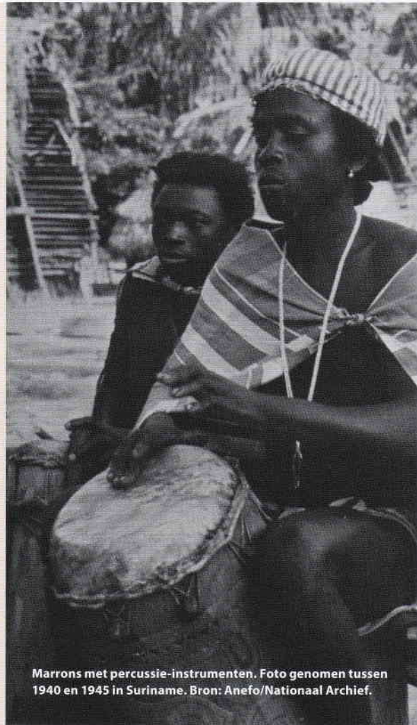
Marrons met percussie-instrumenten. Foto genomen tussen 1940 en 1945 in Suriname.